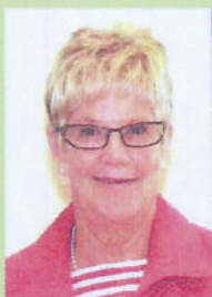
Inger Christensen 3.