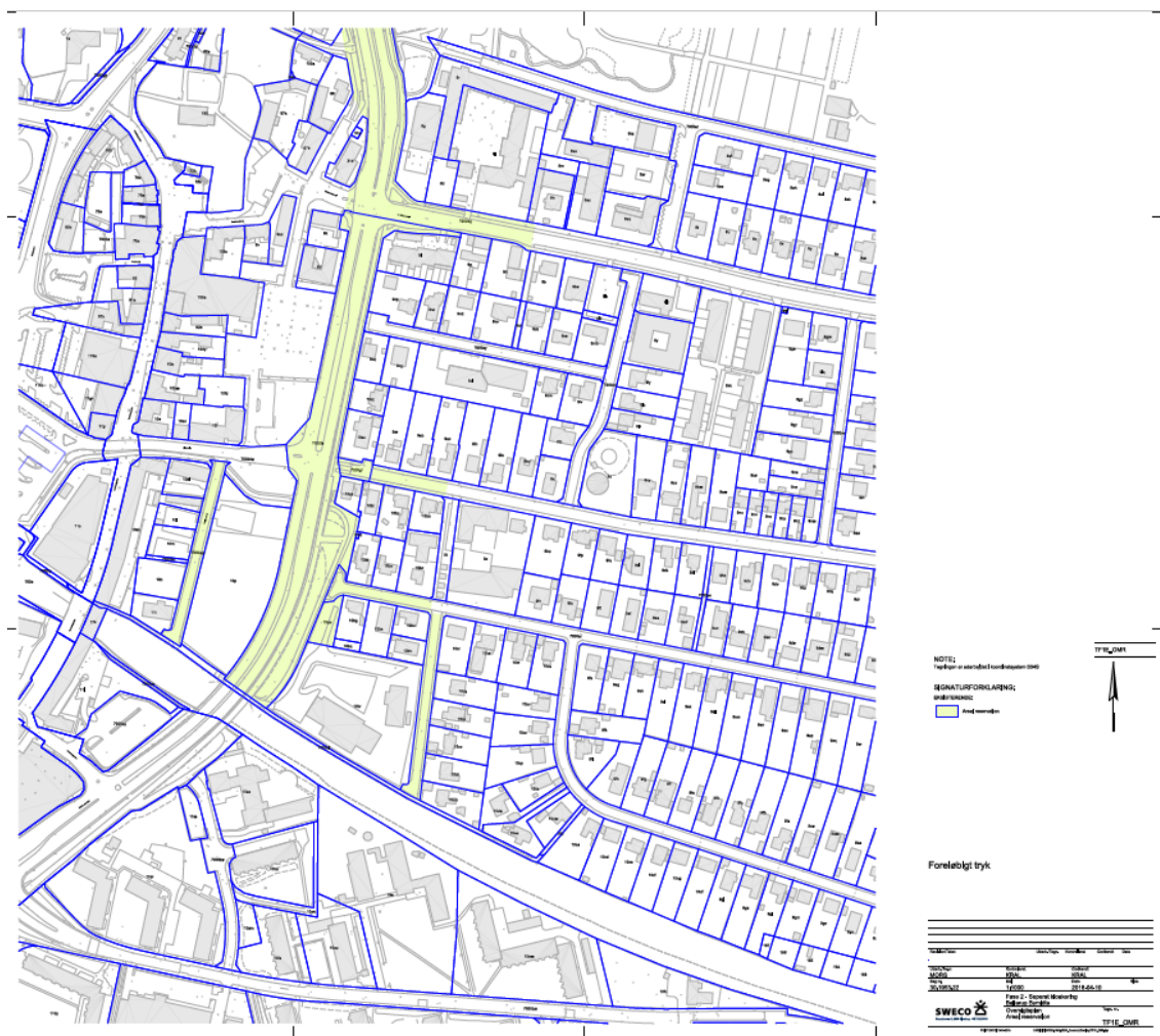
Figur 3 Arealreservation

Med dette separeringsprojekt sker en ændret tilledning til henholdsvis Renseanlæg Avedøre, Ballerup Å og Harrestrup Å.